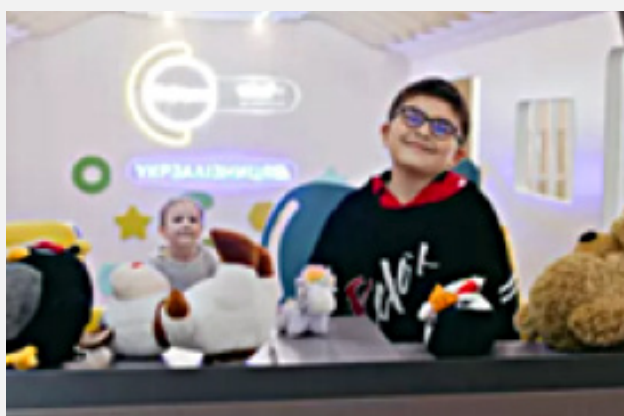
Deux enfants dans un espace adapté aux enfants Spilno Child à Odessa

soulager le stress et l'anxiété causés par la guerre, à soutenir le développement des enfants et les aide à cultiver leurs talents et avoir accès à leurs loisirs. Nous développons actuellement un concept adapté de centres multifonctionnels où les enfants et leurs parents peuvent accéder à un plus large éventail de services psychosociaux et éducatifs."