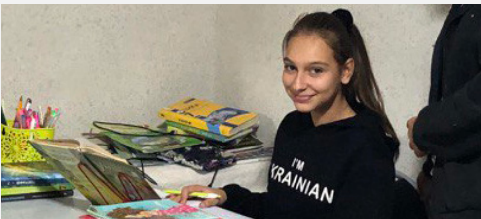
Collectief opvangcentrum in de regio Kiev