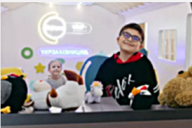
Twee kinderen in een kindvriendelijke ruimte Spilno Spot in Odesa

verlichten, de ontwikkeling van kinderen ondersteunt en hen helpt hun talenten en hobby's te cultiveren. Momenteel zijn we bezig met de ontwikkeling van een aangepast concept van multifunctionele centra waar kinderen en hun ouders toegang krijgen tot een breder scala aan psychosociale en educatieve diensten."